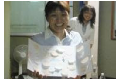
ご結婚おめでとうございます！