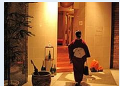
ちょっと高級感がある「リストラ ンテ・フォンタナ」の玄関