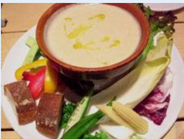
「カンティーナ・ガシーヨ」の パーニャカウダは人気メニュー