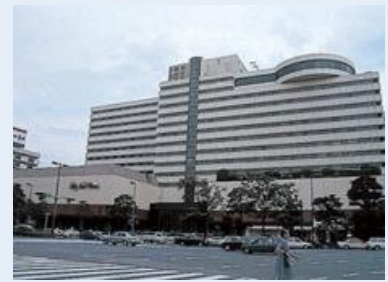
築34年になるホテルニューオータニ

福岡トヨタビルの地下には美味しいイタリアンが2軒入っています。1軒は「ヴェローナ」（中央区渡辺通4-8-28/092-721-0057）。シンプルな料理法が印象的、ピッツァが美味です。もう1軒は「リストランテ・フォンタナ」（同上/092-732-6678）。こちらはメニューも豊富でいかにもレストランという感じです。ついでにもう1軒イタリアンで「カンティーナ・ガシーヨ」（中央区渡辺通2-2-1/092-752-1222）。ここはまたカジュアルな雰囲気のお店でお勧めです。城南線の南側に美味しい蕎麦屋「いとみ」（中央区高砂1-22-9/092-526-4504）があります。酒の肴も揃っていて、蕎麦で一杯という方は是非覗いてみてください。最後は九電ビルの裏側にある居酒屋「暮れ六つ」（中央区渡辺通2-1-23/092-739-9898）。美味しくて年中無休で、12時まで開いているので便利です。