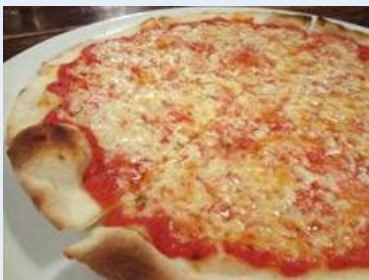
絶品のトマトのピッツァを食べて 欲しい「ヴェローナ」