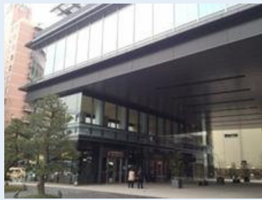
新しい九電はガラスが主体