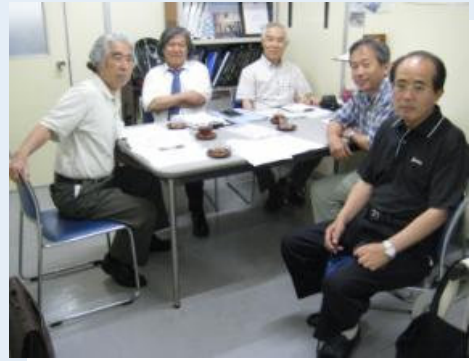
6月14日 支部幹事会：事務局にて

日時：8月3日（金） 於 ビアホール「博多」 時間：18:00～ 幹事会 18:30～ 納涼会を開催します