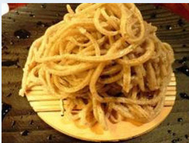
こしと喉越しが美味しい「いとみ」 の手打ち蕎麦