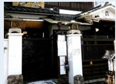
メニューもお値段も納得の居酒屋 「暮れ六つ」の入り口 ※画像はすべてウェブサイトから転載しました。