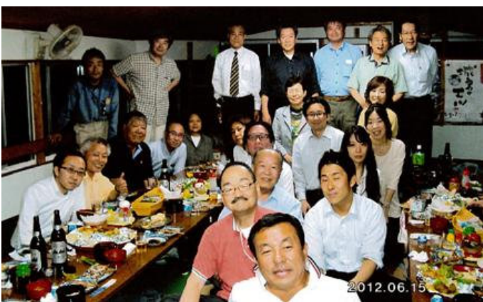
中野支部長はじめ、県南支部の皆さま大御世話になりました。

会員の皆様、今年度も夏、冬の例会、講習会、研修会等、色々企画していますので、一人でも多くの参加を期待しております。一緒に楽しみましょう。