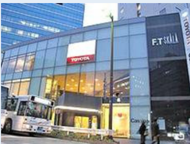
地下にイタリアンが2軒入っている 福岡トヨタビル

福岡トヨタビルの地下には美味しいイタリアンが2軒入っています。1軒は「ヴェローナ」（中央区渡辺通4-8-28/092-721-0057）。シンプルな料理法が印象的、ピッツァが美味です。もう1軒は「リストランテ・フォンタナ」（同上/092-732-6678）。こちらはメニューも豊富でいかにもレストランという感じです。ついでにもう1軒イタリアンで「カンティーナ・ガシーヨ」（中央区渡辺通2-2-1/092-752-1222）。ここはまたカジュアルな雰囲気のお店でお勧めです。城南線の南側に美味しい蕎麦屋「いとみ」（中央区高砂1-22-9/092-526-4504）があります。酒の肴も揃っていて、蕎麦で一杯という方は是非覗いてみてください。最後は九電ビルの裏側にある居酒屋「暮れ六つ」（中央区渡辺通2-1-23/092-739-9898）。美味しくて年中無休で、12時まで開いているので便利です。