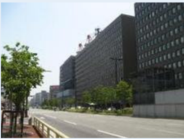
古い九電は重厚なビルだった

南天神という地名は実はありません。では、南天神というのはどこを指すのかというと、概ね国体道路と城南線に挟まれた渡辺通1丁目から5丁目、場合によっては城南線の南側の高砂1丁目や清川1丁目あたりまでを指すようです。天神の中心がパルコ（旧岩田屋デパート）のある交差点だった頃、この地区はRKB放送と九電とホテルニューオータニ以外は何にもない場所でした。天神の中心が西通りに移り、さらに今泉界隈がにぎやかになってきた1990年代頃から再開発が進みだし、商業施設もはりついて、結構おもしろい地区になってきた気がします。特にこの5年間は九電の古くて威圧的だったビルが少しずつ建て替わり、この界隈の通りの表情によりやく明るさと華やかさが加わってきました。そういう意味では、建築の、景観に対する役割の重要性を判らせてくれる好例ともいえる一帯なんですね、南天神は。